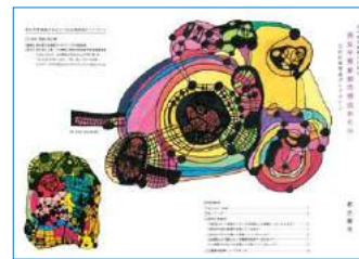
冊子の表紙デザインに使用された例 2023.3