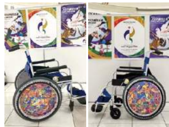
アジア・アジアパラ競技大会のPR用車いすのホイールに使われた例 2023.2

発達障害啓発プロジェクト以外でも名古屋市の制作物などのデザインにアールブリュット作品が使われています。