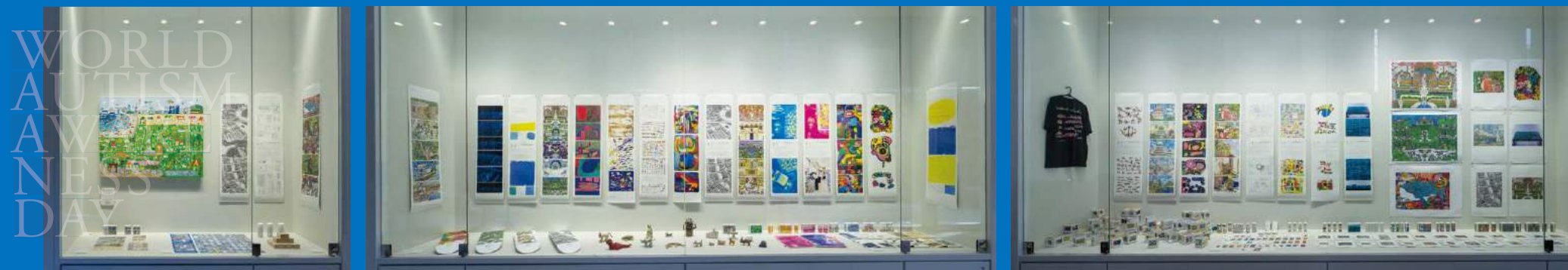
撮影場所：中部SDGsフェスティバル丸の内会場（名古屋東京海上日動ビル）